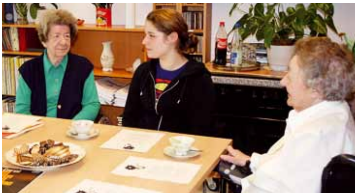
Die Seniorinnen erzählen einer Schülerin von ihren Kriegserlebnissen.

Die Fakten zu den Weltkriegen lernen die vier Schüler des Bochumer Hildegardis-Gymnasiums im Unterricht. Was aber Krieg ganz persönlich bedeutet – Angst, Hunger, der Verlust von Angehörigen –, davon erfahren sie im Gespräch mit Augenzeugen. Seit März treffen sie sich jeden Montag mit sechs Seniorinnen aus dem Katharina-von-Bora-Haus, um die Geschichte lebendig zu machen. Auf dem Tisch stehen ein Volksempfänger und ein Grammophon, die Gruppe trinkt aus Sammeltassen.