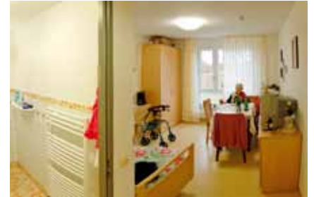
Zimmer im Neubau

auf dieser Etage ist das gemütliche Kaminzimmer, das mit Ohrensesseln und Bücherwand zum Schmökern einlädt. Die Kurzzeitpflegegäste können an allen Angeboten des Hauses kostenfrei teilnehmen.