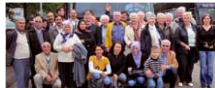
Gruppenfoto nach der Pause

Die Stimmung im Bus wurde immer besser. Es wurden die Sitzplätze gewechselt, so dass die Reisenden miteinander ins Gespräch kommen konnten. Als dann die ersten Lieder angestimmt wurden, sang gleich die ganze Gruppe mit.