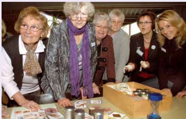
Im Workshop „Spiele ohne Grenzen“ lernten die Ehrenamtlichen neue Beschäftigungsangebote kennen.

„Zum Wohl“ – auf einem Empfang stieß die Diakonie Ruhr mit den Ehrenamtlichen an, die sich in den Einrichtungen der Altenhilfe engagieren. Neben dem Dankeschön standen vor allem Austausch und Anregung im Mittelpunkt des traditionellen Ehrenamtsabends. „Sie brauchen Energie, Wissen, Kontakt und Zeit für Ihr Engagement. Vielen Dank,