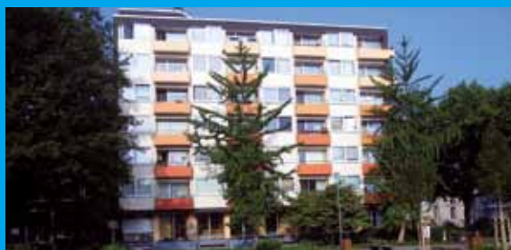
Das Albert-Schmidt-Haus mit farbenfroher neuer Fassade