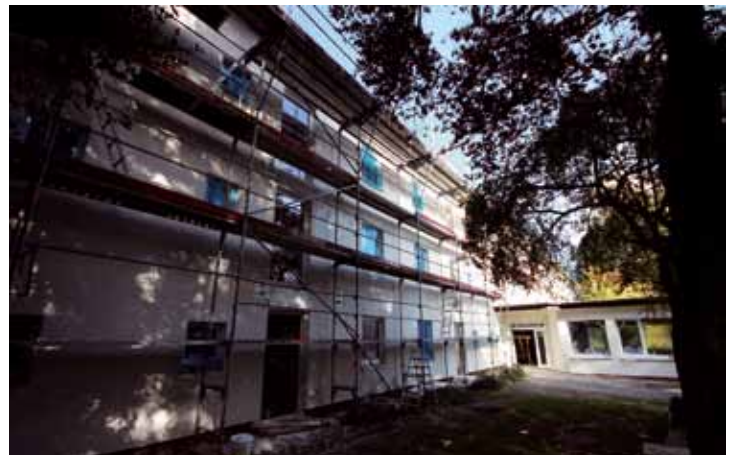
Das Feierabendhaus II aus den 50er Jahren erhält beim Umbau auch eine wärmedämmte Fassade.

im Keller. Als Grundausstattung verfügt jede Wohnung über ein Notrufsystem für medizinische Notfälle. Die Bewohner des Hauses können einen sehr großzügigen gemeinsamen Veranstaltungsraum als zentralen Treff- und Kommunikationspunkt nutzen. Der Schwesternpark und die auf beiden Seiten des Hauses angelegte Grünanlage können von den Mietern und deren Besuchern selbstverständlich aufgesucht werden.