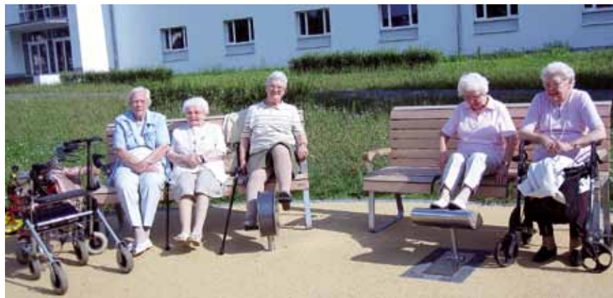
Senioren aus dem Albert-Schmidt-Haus trainieren im Generationenpark an den Bewegungsgeräten.

Der weiteste Weg beginnt immer mit dem ersten Schritt, sagt man. So ging es auch den Senioren des Albert-Schmidt-Hauses bei der Mitgestaltung des Generationenparks vor etwa zwei Jahren. Die ersten Schritte sind gemacht und der Generationenpark konnte am 20. Juni 2011 eröffnet werden. Mit einem kleinen Fest, sehr vielen Bewohnern des Westends und mit reger Beteiligung des Albert-Schmidt-Hauses wurde der Generationenpark der Bevölkerung übergeben. Neben vielen Redebeiträgen wurde das Fest eingerahmt vom Generationenchor der Arnoldschule und des Albert-Schmidt-Hauses, in dem Kinder und Senioren gemeinsam musizieren.