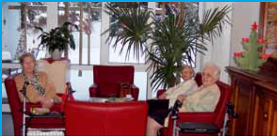
Gemütliche Sitzzecke mit rotem Leder im neuen Eingangsbereich des Altenzentrums Rosenberg