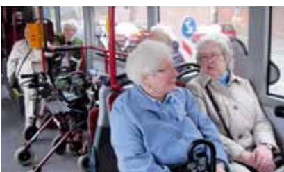
Die Übungen im Bus sorgten für angeregte Gespräche.

Ein Bus kann ein Angstraum sein – so empfinden es oft Senioren, die mit öffentlichen Verkehrsmitteln unterwegs sind. Polizei und Bogestra kennen dieses Problem und haben ein Projekt entwickelt, um älteren Menschen zu zeigen, wie sie sicherer in Bus und Bahn fahren. 23