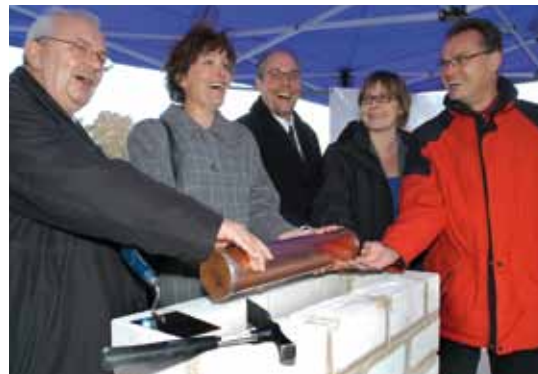
Der Grundstein für das Feierabendhaus II liegt.