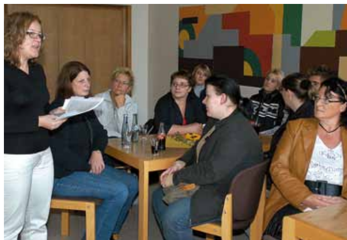
Teilnehmer des Altenhilfetages am 19. September während eines Workshops

Für berufliche Pfleger sind Fragen der Selbstbestimmung Pflegebedürftiger von zentraler Bedeutung. Im Pflegealltag gilt es, vor dem Hintergrund jeder einzelnen Pflegesituation den Grat zwischen Selbst- und notwendiger Fremdbestimmung zu finden. Es gilt in jedem Einzelfall Entscheidungen zum Wohl des Pflegebedürftigen zu treffen oder seine Entscheidungen zu akzeptieren und die Pflegesituation entsprechend zu gestalten. Dabei kommt es immer wieder