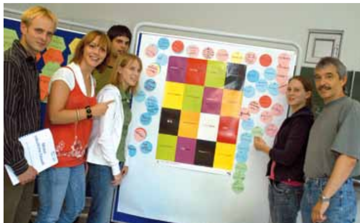
Schüler zeigen die Infowand zur Themenwoche.

→ Weitere Informationen unter: www.comenius-bk.de und www.rosenstraße76.de