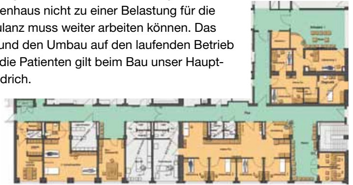
Ein Überblick über das erste Obergeschoss

sätzliche Kühlung erhalten. In der Optik werden die Räume hell und freundlich. Im Wartebereich werden sie zusätzlich mit Monitoren ausgestattet. So können die Patienten zum Beispiel mit dem Krankenhausfernsehen Neuigkeiten und Aktuelles aus dem EVK erfahren. Aber der Umbau dient nicht nur der Ästhetik, sondern führt auch zu einer weiteren Verbesserung der räumlichen Situation und damit der Arbeitsbedingungen für die Mitarbeiterinnen und Mitarbeiter in diesem Bereich. Insgesamt kostet der Umbau 400 000 Euro. •