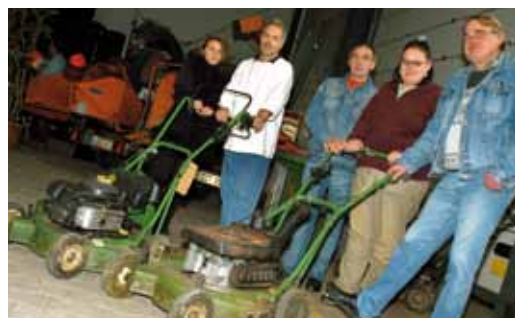
Seit Oktober haben die Gärtner ein neues Gebäude.

Bewatt weht neues Gebäude für die Gärtner ein