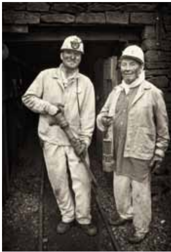
Das Titelbild des Kalenders

Aufgrund des großen Erfolges der beiden Vorgänger gibt das Altenzentrum am Schwesternpark Feierabendhäuser nun schon zum dritten Mal unter dem Motto „Schönheit im Alter“ einen Jahreskalender heraus. Die neue Ausgabe für 2012 trägt den Untertitel „Alte Berufe“. Sie zeigt Bewohnerinnen und Bewohner in beeindruckenden Schwarzweiß-Aufnahmen. Entstanden sind die Fotos in den LWL-Industriemuseen Zeche Nachtigall in Witten, Henrichshütte Hattingen, Zeche Zollern in Dortmund und Textilmuseum Bocholt sowie im LWL-Freilichtmuseum Hagen. Dort setzte Andreas Vincke, Einrichtungsleiter der Feierabendhäuser und leidenschaftlicher Fotograf, die Fotomodelle stilecht in Berufskleidung am historischen Arbeitsplatz ins rechte Licht.