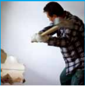
Im Feierabendhaus II wird momentan der Hammer geschwungen.