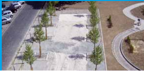
Blick auf den Generationenpark am Albert-Schmidt-Haus