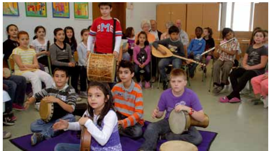
Der Chor „Klänge der Generationen“ bei der Probe.

Da ist einmal der Fahrradkurs für erwachsene Frauen mit und ohne Migrationshintergrund, der am 12. Mai begann. Ziel ist es, zunächst einmal das Fahrradfahren zu lernen. Ganz nebenbei können sich die Teilnehmerinnen untereinander auszutauschen und die deutsche Sprache festigen. Neben dem Sport findet so auch ein interkultureller Austausch statt. Natürlich wird es später auch gemeinsame Radtouren geben.