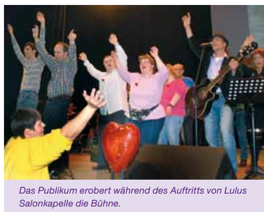
Das Publikum erobert während des Auftritts von Lulus Salonkapelle die Bühne.