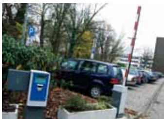
Noch stehen die Schranken offen.

Die Inbetriebnahme der Schranken und Kassenautomaten erfolgt allerdings erst nach Abschluss der Kanalbauarbeiten auf der Pferdebachstraße, die voraussichtlich bis April oder Mai 2011 dauern werden. Da die Schranke zum Wirtschaftshof hinter dem Krankenhaus künftig nur von Notarzt- und Ret-