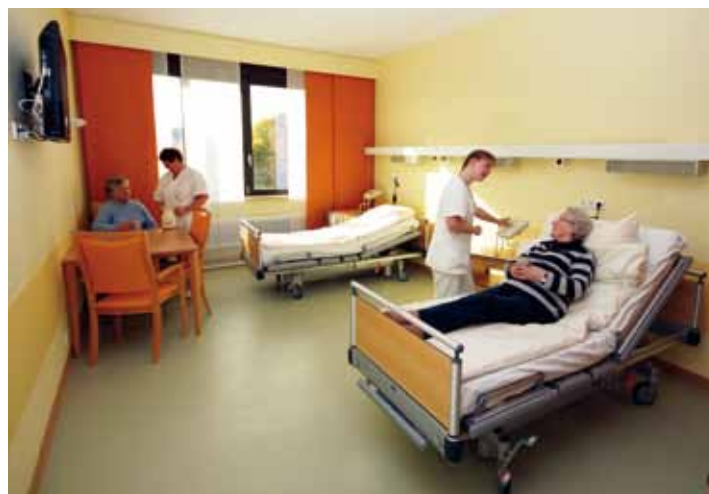
Blick in ein saniertes Patientenzimmer

wecken. Hell und freundlich leuchten auch die Polster der Sessel und Sofas in den Aufenthaltsbereichen. Die Station 3 CD wird als geriatrische Station für 18 Patienten genutzt. Sie ist besonders auf die Bedürfnisse älterer Patienten ausgerichtet. So gibt es einen großen Aufenthalts- und Essbereich, in dem sie gemeinsam die Mahlzeiten einnehmen oder an Angeboten der Therapeuten und Pflegekräfte teilnehmen können. Im ehemaligen Kreißaal der früheren