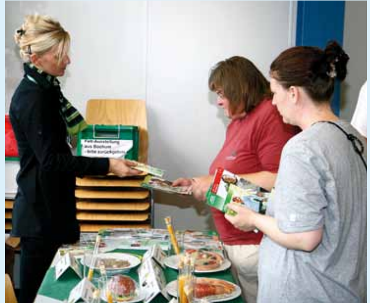
Wie viel Fett steckt in einer Fertigpizza? Die Ernährungsberatung der AOK zeigte anschaulich, was in Fast Food enthalten ist.